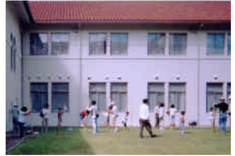
竹馬は男女共に人気がある。