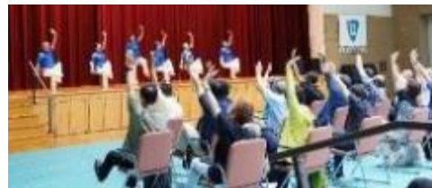
太極拳ゆったり体操

の語り部」、「区会活動」を紹介しました。学生からは「ボランティア活動の熱心さが伝わってきました」、「趣味の活動や身近なボランティア活動がたくさんあることを再認識しました」などの感想をいただきました。