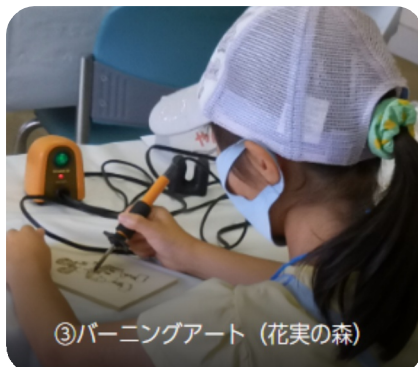
③バーニングアート (花実の森)