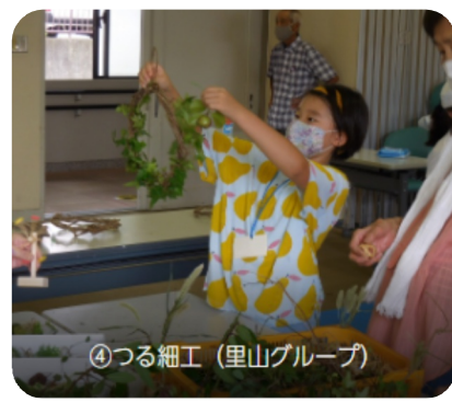
④つる細工 (里山グループ)