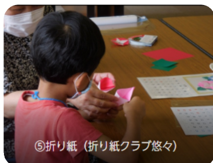
⑤折り紙 (折り紙クラブ悠々)