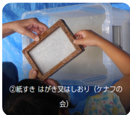
②紙すき はがき又はしおり (ケナフの会)