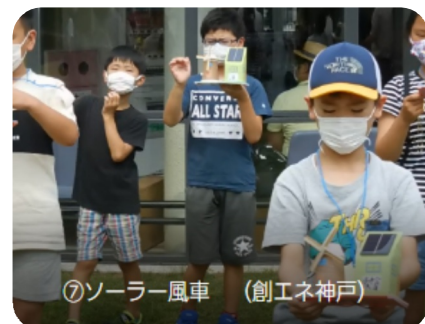
⑦ソーラー風車 (創エネ神戸)

8月8日(土)、しあわせの村研修館にて、子どもたち期待の「夏休み工作塾」を今年も開催しました。今年は完全予約制を採用し、コロナウィルス感染予防対策を徹底した会場で、小学生の子どもたち76名がそれぞれの作品の制作に奮闘しました。