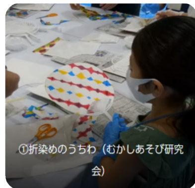
①折染めのうちわ (むかしあそび研究会)