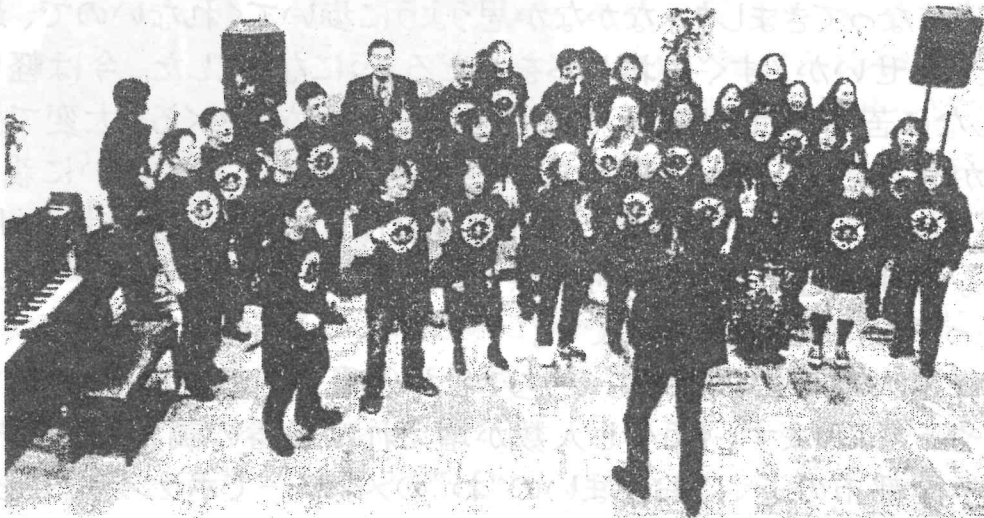
KOBE Mass Choir (神戸マス・クワイア) プロフィール

一般的にゴスペルと聞くと、アフロ・アメリカン(アフリカ系アメリカ人)が 演奏している場面を想像しますね？それもそのはず、ゴスペルの発祥 はアフロ・アメリカン達の歴史と切っても切り離すことができません。 《ゴスペル》とは、アフロ・アメリカンの苦難の歴史の中から生まれた、 「祈りのうた」です。長い奴隷制度の苦しみ・差別などの苦しみ。人々 は、それでも教会で神に祈り歌うことを通して「生きる意志」を育ててき ました。やがてその中からキング牧師などによる公民権運動(黒人解 放運動)が発生していきます。 ゴスペルとはこのような歴史を持つ、限りなくパワーを秘めた音楽です。