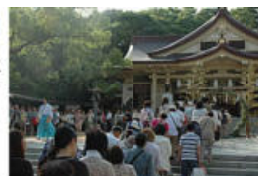
(湊川神社 茅の輪ぐりの様子)

「人形(ひとがた)」は12センチぐらいの切り紙で、氏名と年齢を書き、神社にお祓いを託すものです。この人形で身体をなでてから3度息を吹きかけ、神社に納めます。