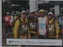
神戸マラソンでのインフォメーション