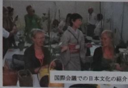
国際会議での日本文化の紹介