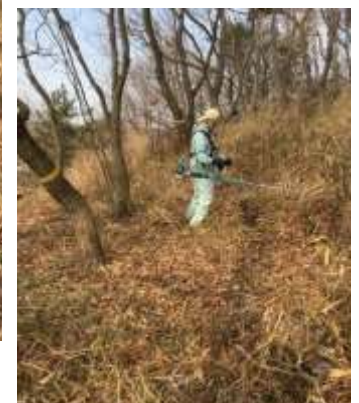
今回は刈払機が出番の作業

通年の里山整備・再生作業のなかでも、この時期は春の野草の芽吹きを控えてのネザサ刈りは手が抜けない。しっかり刈ってササユリをはじめとする多くの貴重な山野草たちが育ち、今年もかれんな花を楽しませてもらうためにもしっかり刈り取ろう。多様な生物が育つこの里山もきっと応えてくれるはずだから。