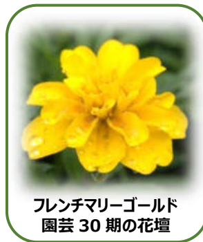
フレンチマリーゴールド 園芸 30 期の花壇