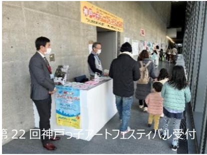
第22回神戸っ子アートフェスティバル受付