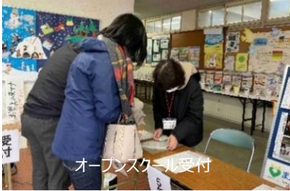
オープンスクール受付