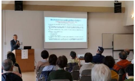
第8回健康増進セミナー 3月21日