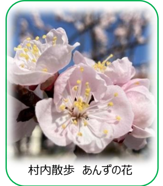
村内散歩 あんずの花