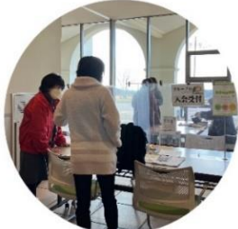
新入会員受付 ふれあいホール