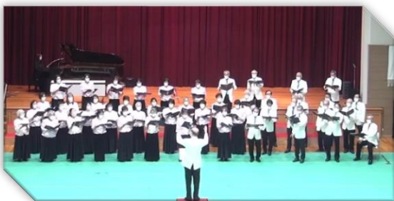
ジョイラックディ 2 月

練習日は毎週月曜日午後から「しあわせの村研修館大ホール」で行っています。ここ数年はコロナまん延防止対策のため練習ができないこともありましたが、マスク着用・席の間隔を確保・消毒・換気等注意しながら練習をしています。