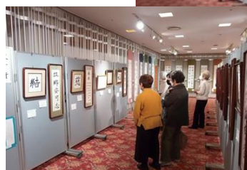
作品を鑑賞される皆さん