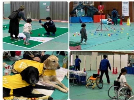
ユニバーサルフェスタ 3月11日