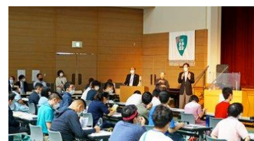
久元神戸市長の特別講義

日時：6 月 11 日（土） 場所：シルバーカレッジホール 10 時～講義 13 時～部活動紹介 14 時～ホームルーム