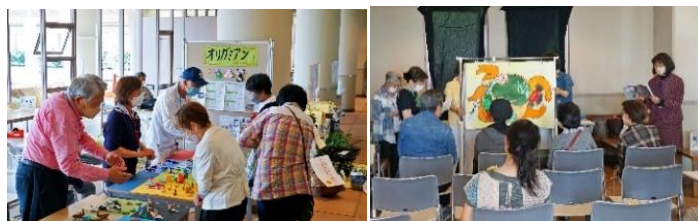
大人気！大人の折り紙 オリガミアン

ステージプログラムでは 13 のグループの披露、また、ふれあいホールでは 6 つのグループが参加、どちらも大盛況で笑顔のあふれる楽しい時間でした。テレビモニターを置き、舞台の様をライブビューイングで楽しんでいただきました。活動紹介展示、「戦争の語り部」も映像で紹介しました。会員の皆さまからは、久しぶりに皆で練習を重ね、舞台に立つことができ楽しかったという嬉しい声をたくさんいただきました。また、多数の方に最後まで観覧いただきありがとうございました。