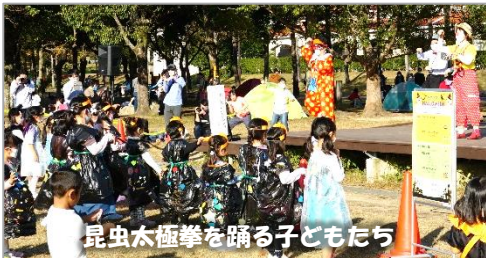
昆虫太極拳を踊る子どもたち