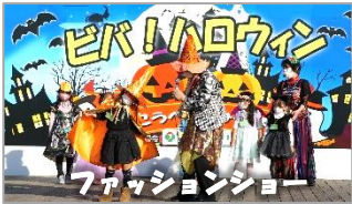
ファッションショー