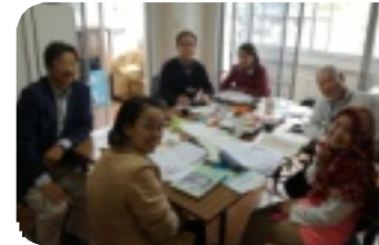
研修生日本語学習支援 支援切手整理