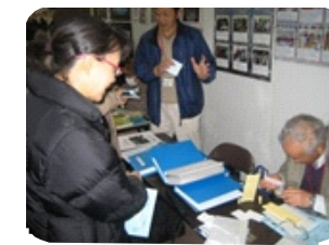
英語点字の名刺作りデモ