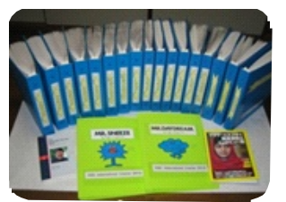
ミャンマーに送付した点訳本