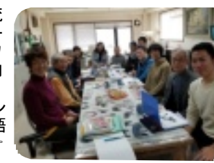
ミャンマー語講座