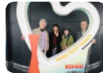
留学生交流でポートタワー案内

2005年春国際9期卒業生でスタートした活動は今も続いている。主な活動はミャンマー旅行を組み、英語点字本（KSC英語点字本クラブ作成）をヤンゴンとピンウールン盲学校に届ける事。私が10度ヤンゴン盲学校へこの点字本を届けたことから、「わ」2017年度総会で功労賞を受賞した。 ミャンマー留学生との交流を、国際部会例会日や奈良・王子動物園で行う。ミャンマー語講座を月1回「NPO法人神戸ミャンマー皆好会」で共に学習。