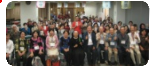
2018.3.台中「曉明長青大学」との交流にて