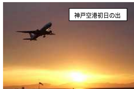
神戸空港初日の出

4月の情報ギャラリーと一緒に用紙を配布し、次号には新会員も増えるのでそれを反映したものにしていきたいと思っています。よろしくご協力ください。(MH)