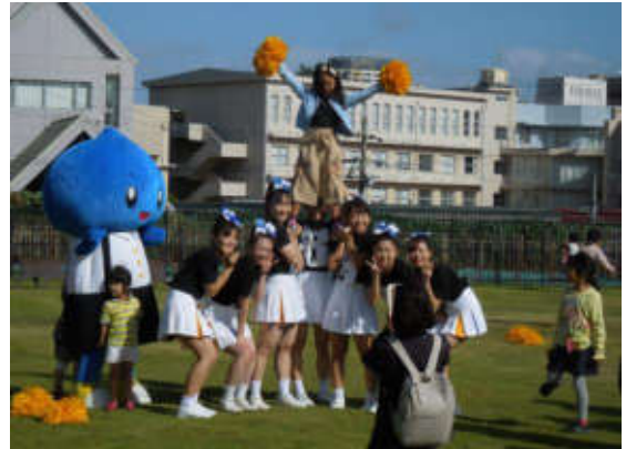
わ 水博フェスティバル イン 2019 水博

NPO 法人社会還元センターグループわ のボランティア活動グループがあなたを支援・手伝いをします。グループわ へのご相談、支援依頼を受け付けております。詳しくは、電話 078-743-8101 または、インターネット『神戸市シルバーカレッジ・グループわ』検索でお問い合わせ下さい。