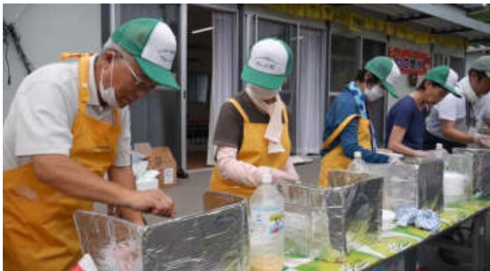
2019年6月 復興サポート隊 岡山県真備町訪問