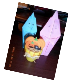
今月はハロウィンのおバケ