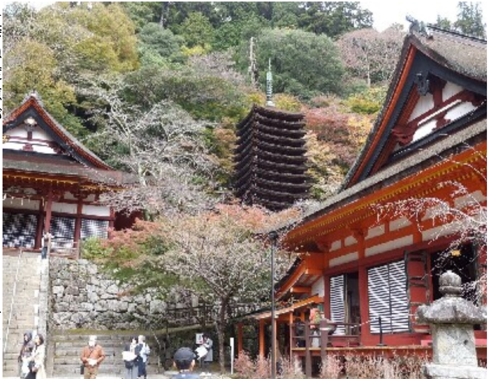
静かな晩秋のたたずまいに包まれる談山神社

昼食は多武峰観光ホテルで。大和豚鉄板焼きをメインに皆さんも満喫されたようです。5階ベランダからは塔を見下ろせるので写真撮影にはいい場所でした。沿道には、焼き草餅、割れ三輪そうめん、こんにゃく、