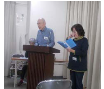
11月9日民謡クラブ例会の一コマ