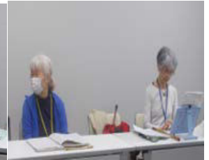
11月10日民謡同好会練習日の一コマ

11月6日の例会時に手書きの順番表に基づき次回から練習をしていく予定です。次回1~20番?と合唱曲も練習予定。発表会迄の岡部先生の指導は5回です。頑張りましょう。