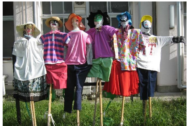
〈 完成した案山子 〉