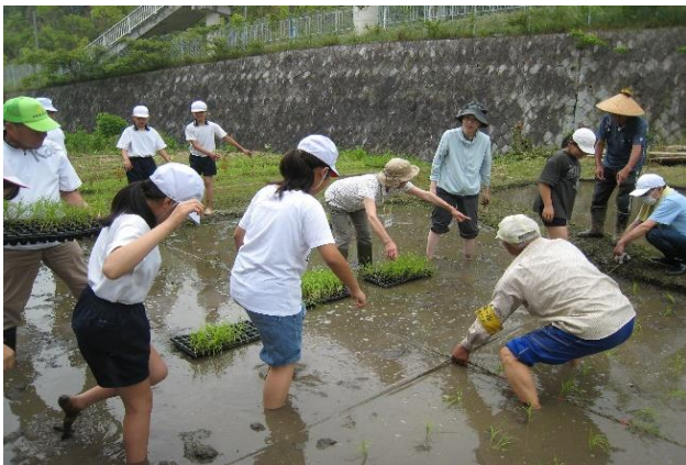
〈 田植えの準備作業 〉

10月には稲刈りと脱穀がありますが、脱穀には「足踏み式脱穀機」や「唐箕」など昔からの機械を使います。生徒達も勿論ですが、保護者の方も初めての方が興味津々操作されています。