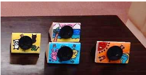
ソーラーオルゴール