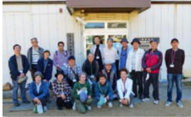
「カモメ」「西北」「保久良」西岡本公園