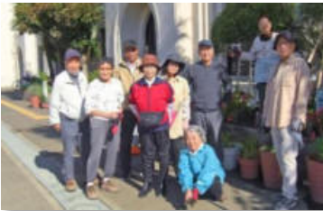
「サルビア南」花壇整備