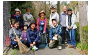
「泉台」地域美化・花壇整備