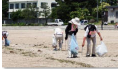
須磨「村雨」グループの海岸清掃