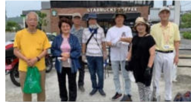
「やまもも」地域清掃活動