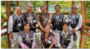
植栽・野菜作り手伝い「ほくしん」