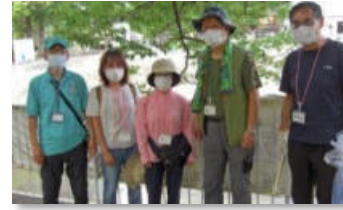
「マリーゴールド」都賀川の守り