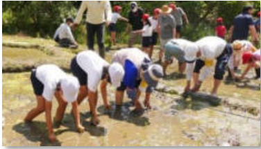
横尾小学校「田植え」ボランティア