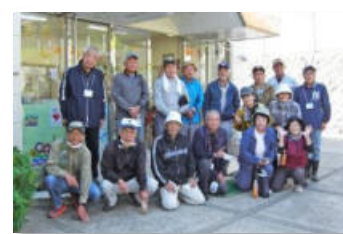
「すずらん東」植栽整備支援