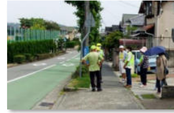
星和台小学校の見守り隊