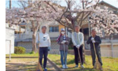
「すずらん」地域美化・学習支援