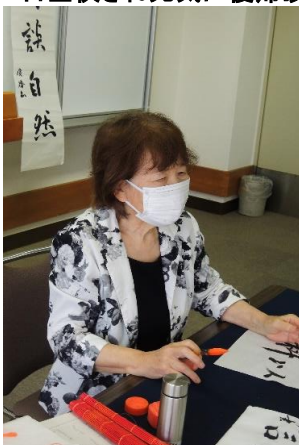
鬼さん先生に添削中