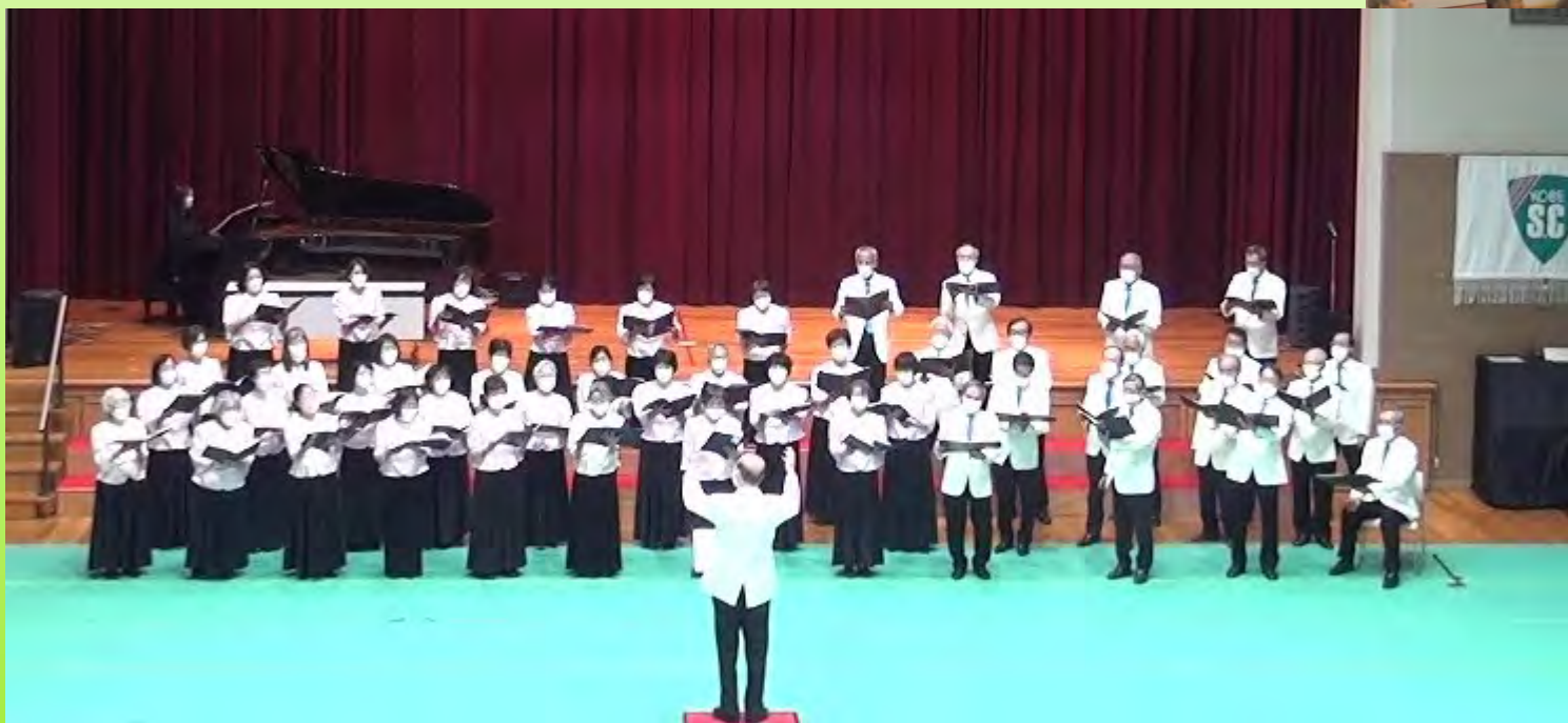
カレッジホールでの発表