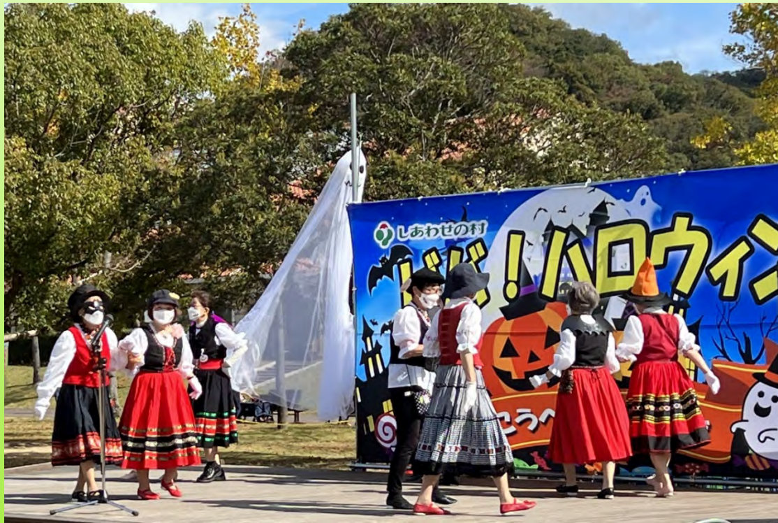
ビバ! ハロウィン出演