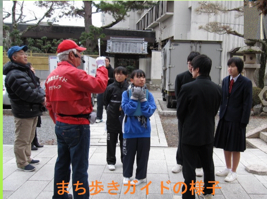
まち歩きガイドの様子