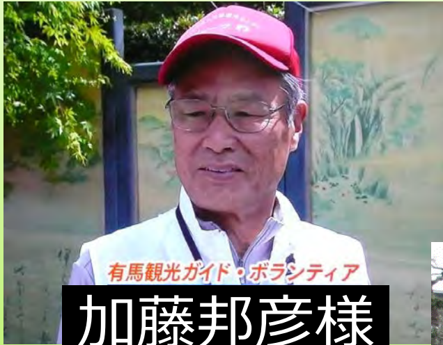
有馬観光ガイド・ボランティア