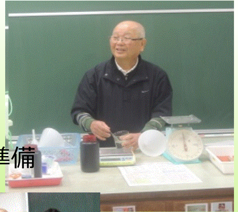
理科の実験の準備