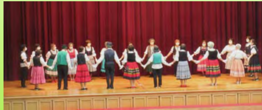
歓迎交流会に出演