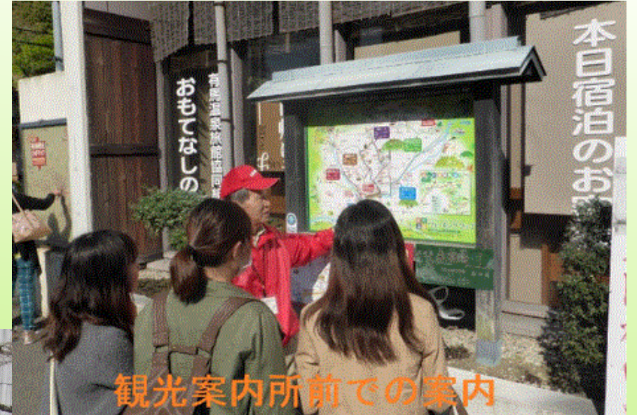
観光案内所前での案内