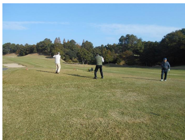
ウォーミングアップ中