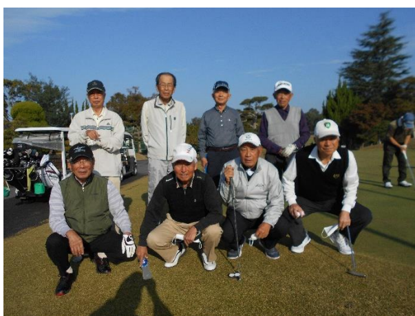
スタート前の記念撮影