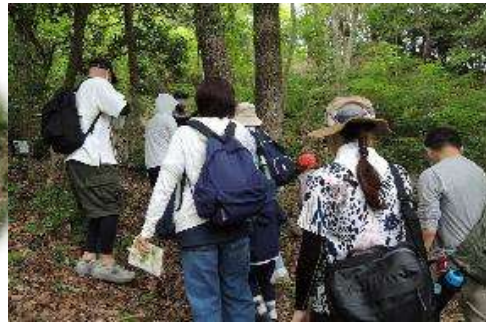
かがやきの森散策