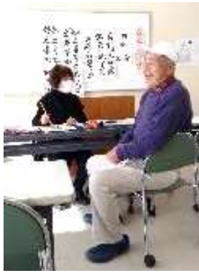
自由課題にチャレンジ～