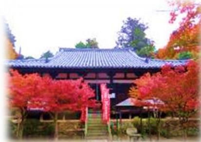
淡河の古刹；石峯寺本堂