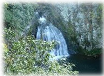
淡河の名瀑；曇り滝