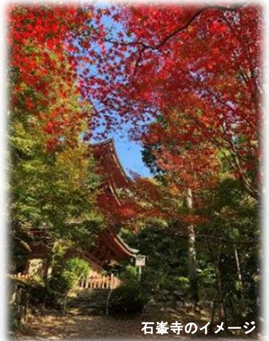
紅葉に映える石峯寺 朱塗りの三重塔