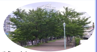
★涼しそうですね！ 夏の桜並木敷 “旧神戸臨港線跡”