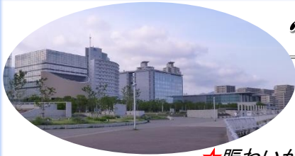
★賑わいが増す！ HAT神戸 “なぎさハーバーウォーク”