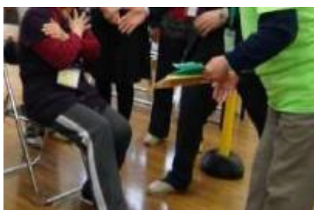
片足で立ち上がれるかな？

フレイルサポーター が フレイルトレーナー（専門家） と一緒に計測機材やチェックシートを使ってフレイルチェックのお手伝いをします。いっしょに、今の状態をチェックしましょう！