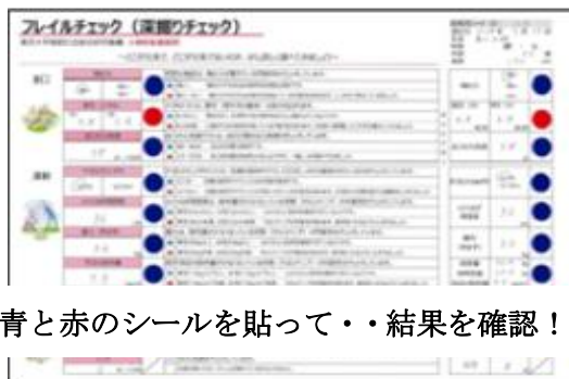
青と赤のシールを貼って・・・結果を確認！

感染症対策のためにマスクの着用をお願いします。万全の感染症対策をして実施いたします。そのため、一部測定できないものもあります。写真はコロナ以前のものです。