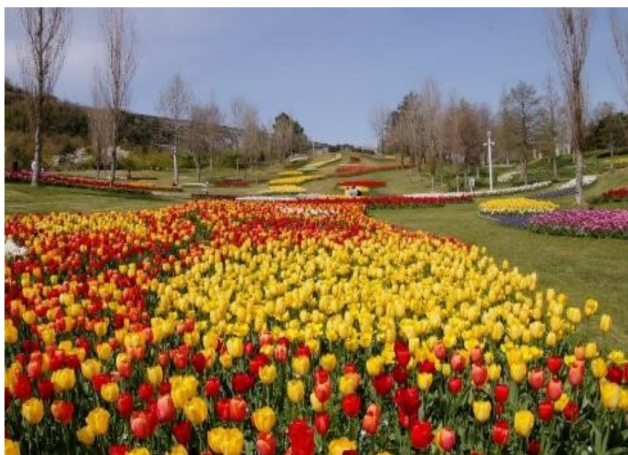
写真＝淡路島のチューリップ花壇。で、写真の会提供

●4講座の講座報告 折り紙＝4月28日。たんぽぽセミナーで。書道の会＝3月29日。KSC4号室で。写真の会＝4月1日。淡路夢舞台で風景を撮る。絵手紙＝4月8日。しあわせの村日本庭園で。