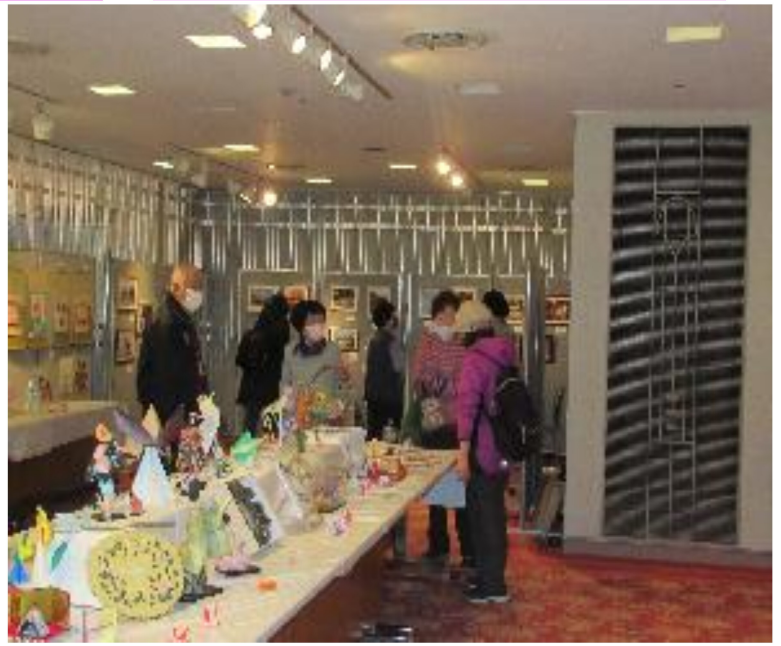
連日、入場者で賑わう作品展会場