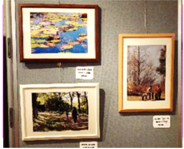
写真の会の作品集