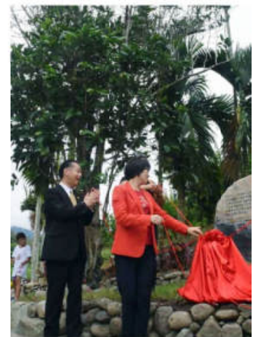
(記念碑除幕式 台東県長、饒慶鈴氏)

台湾では日本統治時代に総督府がコーヒー栽培を奨励し、1930年に住田物産が花蓮郊外に大規模コーヒー農園を経営し1931年には木村商店もコーヒー農園をスタートした。1942年には栽培面積1000ヘクタールを超えた。しかしながら戦争、天災、病害虫によりコーヒー生産は終焉を迎えた。その後1999年の台湾大地震で被害を受けた農地で、付加価値の高い作物としてコーヒー栽培が奨励され、現在では1150ヘクタールまで広がっている。台湾産の豆はフルーティーな香りと爽やかな口当たりで日本にも出荷されている。