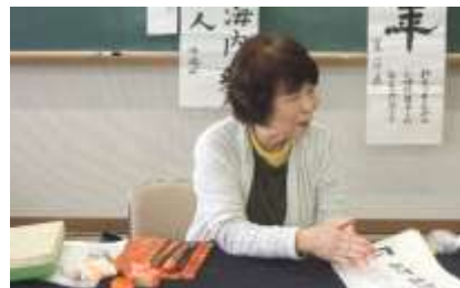
淑子熱血講師 ご指導感謝々。