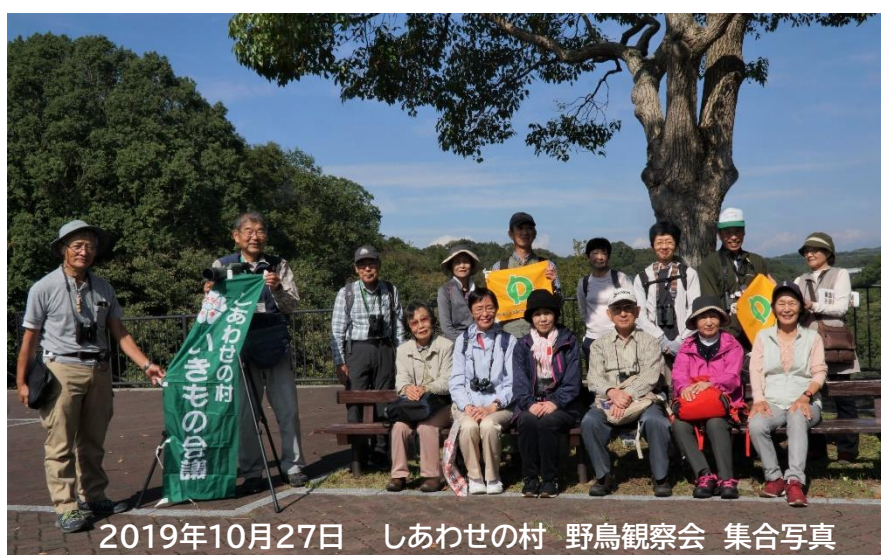
2019年10月27日 しあわせの村 野鳥観察会 集合写真