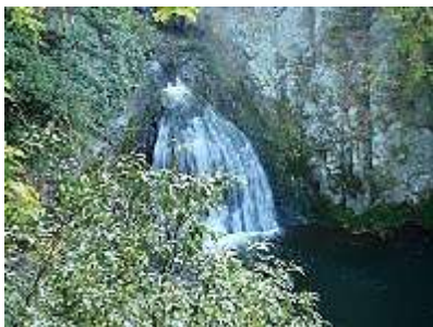
淡河の名瀑：雲り滝