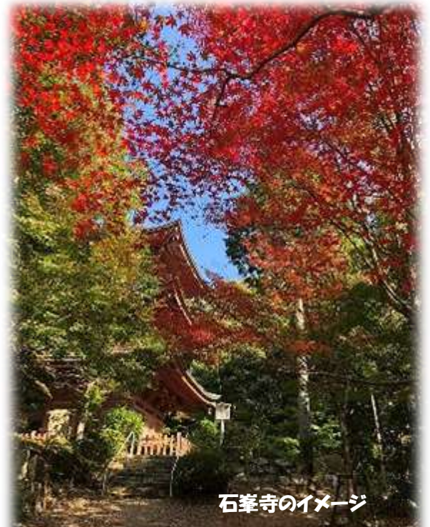
紅葉に映える石峯寺 朱塗りの三重塔