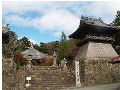
淡河の古刹：石峯寺