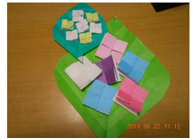
今月の折り紙は「アジサイ」