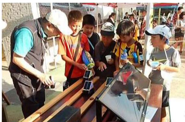
こうやってスイッチを入れると走るよ！ 誰のソーラーカーが早いかな！