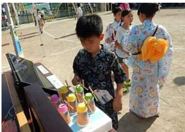
4台のソーラーカー ただいま太陽光で充電中。

風車がなぜ回るのか子どもたちは興味深々！ ソーラーパネルを覆うと風車が止まり、ソーラーパネルにお日さまをあてると風車が回ること、お日さまの力を体感していました。