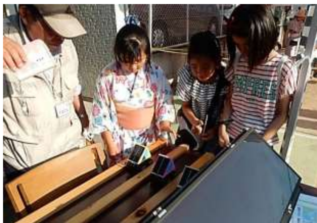
地球温暖化クイズ・太陽光発電クイズも行いました。