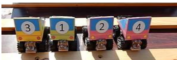
ソーラーカーが動いた！！