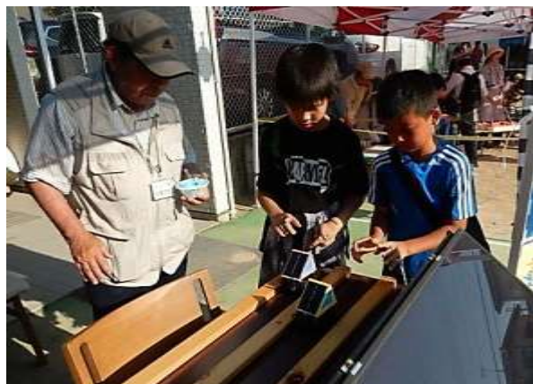
なんどもソーラーカーレースに挑戦していました。