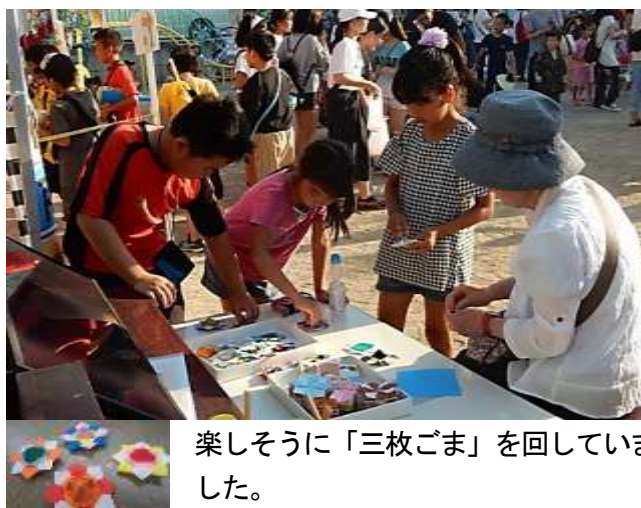
楽しそうに「三枚ごま」を回していました。