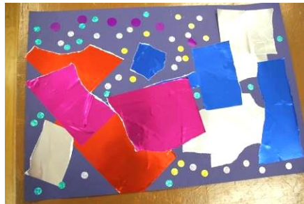
よく描けているとほめられた児童の作品