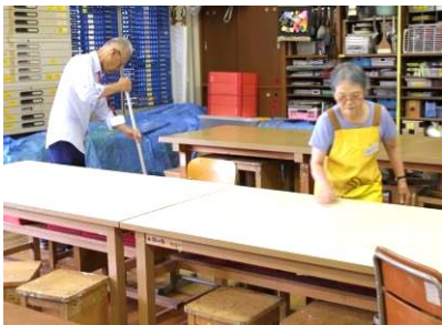
教室の掃除をする灘区会員