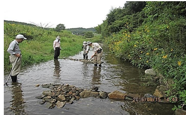
実践：三個のミニサイズ水制工を作る

小さな自然再生～多くの生きものが生息できる川づくり、環境調査、生きもの調査、外来種アカミミガメの捕獲、 子ども向け自然塾開催など環境啓発活動