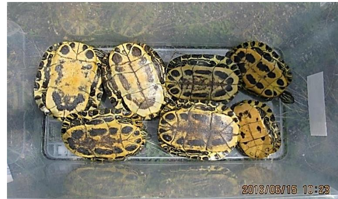
アカミミガメ捕獲